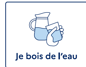
Je bois de l'eau