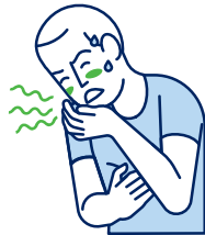
Vertiges / Nausées