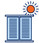
Je ferme les volets et fenêtres le jour, j'aère la nuit