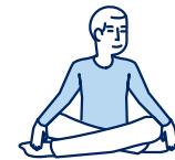
Je fais des activités sans effort