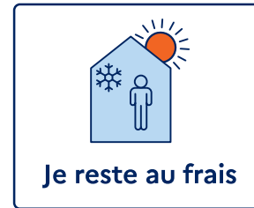
Je reste au frais