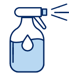
Je mouille mon corps