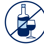
J'évite de boire de l'alcool