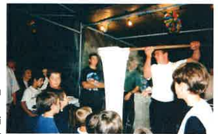
CHALLENGE N° 4

Pendant de nombreuses années le 15 août était synonyme "d'Aligot-saucisse" avec le challenge du comité.