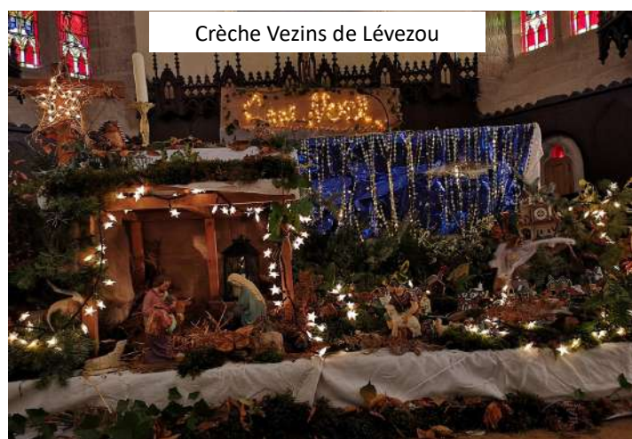
Crèche Vezins de Lévezou