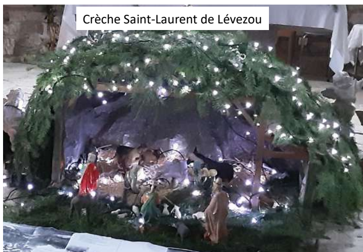
Crèche Saint-Laurent de Lévezou

Dans notre belle région du Lévezou, Noël garde toute son actualité dans nos vies et toute sa joie, avec les nombreuses crèches dans les églises, les belles illuminations dans les villages, les sapins garnis de guirlandes... Car c'est bien pour nous et aujourd'hui que Dieu est venu sur la terre. Que notre paroisse reste toujours disponible à cette magnifique mission qui apporte un peu du bonheur du ciel sur la terre !