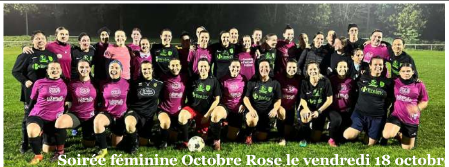
Soirée féminine Octobre Rose le vendredi 18 octobre

En prévision de la seconde partie de saison, chez les seniors, objectif coupe Technicien du Sport pour l'équipe fanion qui a accédé