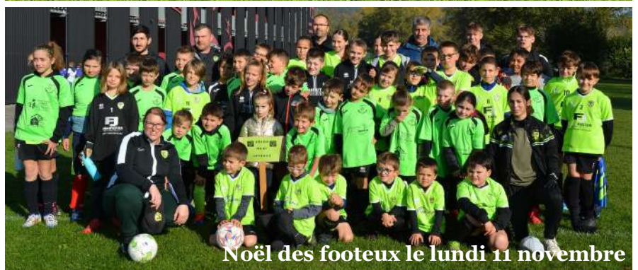
Noël des footeux le lundi 11 novembre

aux quarts de finale, de même pour l'équipe féminine qui est en quart de finale de la Coupe Braley. Chez les jeunes, une sortie pour voir notre belle équipe aveyronnaise du RAF est prévue !